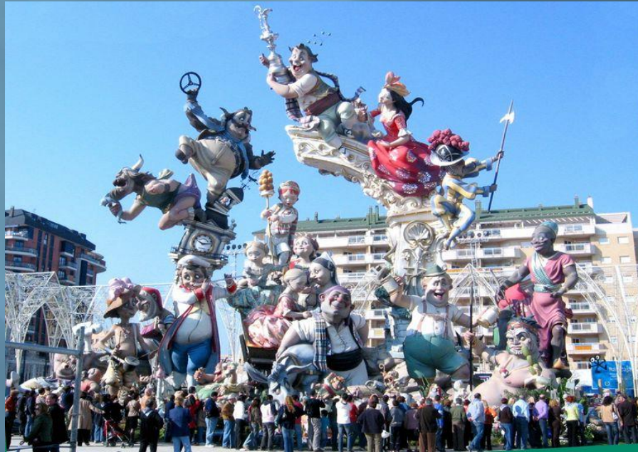
La falla ganadora de 2007

Al fin de la fiesta, la gente selecciona la mejor falla de la celebración. Cada año la mejor falla va al gran museo Fallero.